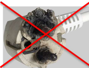
Vanligt uttag sk Schuko