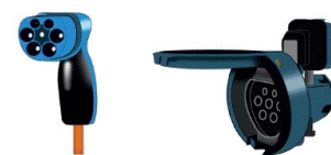
Kontaktton av typ 2 enligt SS-EN 62196-2

Stickpropp över 16A får inte användas som funktionsmanövrering (brytare).