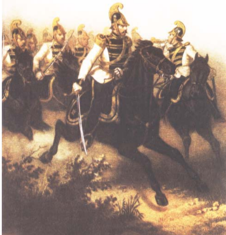
Livregementets dragonkårs uniform modell 1859 efter samtida färglitografi.

Etablissemanget stod färdigt 1881 och var utfört i enkel gulputsad nyklassicism med få utsmyckningar. Närmast nuvarande Sjöhistoriska museet byggdes två långa stallängor parallellt med