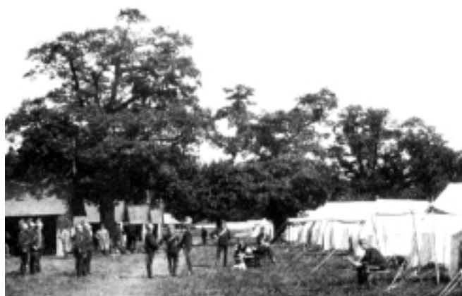
Dragonlägret sett från väster 1892. Till vänster sommarstallarna och till höger raden med officerstält.