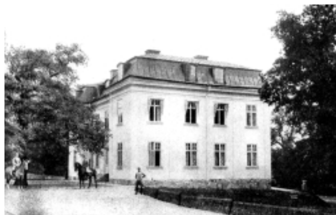
Kanslihuset uppfördes i mitten av den linje där tidigare officerstälten stod, och på platsen för sekundchefens tält.