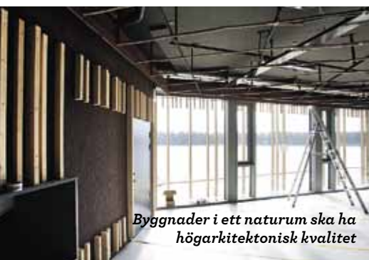
Byggnader i ett naturum ska ha högarkitektonisk kvalitet