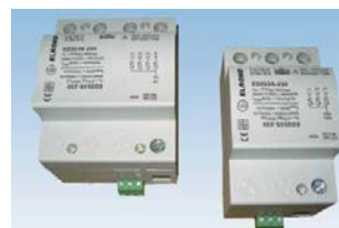
Exempel överspänningsskydd av kombimodell.

Grundläggande krav på överspänningsskydd finns i Elinstallationsreglerna. Överspänningsskydd enligt SS-EN 61643-11. Klasserna benämns även grovskydd (typ 1), mellanskydd (typ 2) och finskydd (typ 3). Typ 1 2 och 3 kan kombineras. Omfattning enligt SS 436 40 00 samt utförandenivå enligt riskbedömning se 66.D ovan.