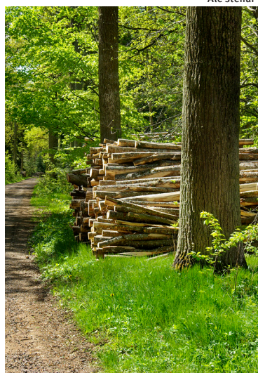
Ekar på Visingsö