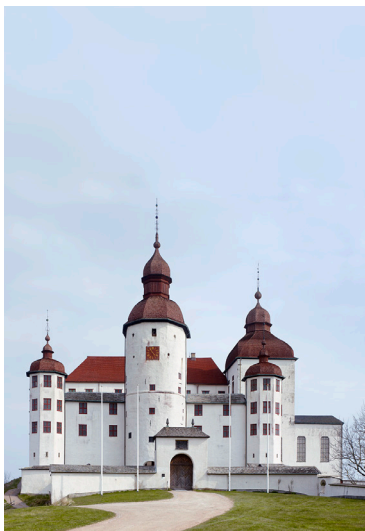
Läckö slott