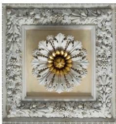
Detalj från Nationalmuseum